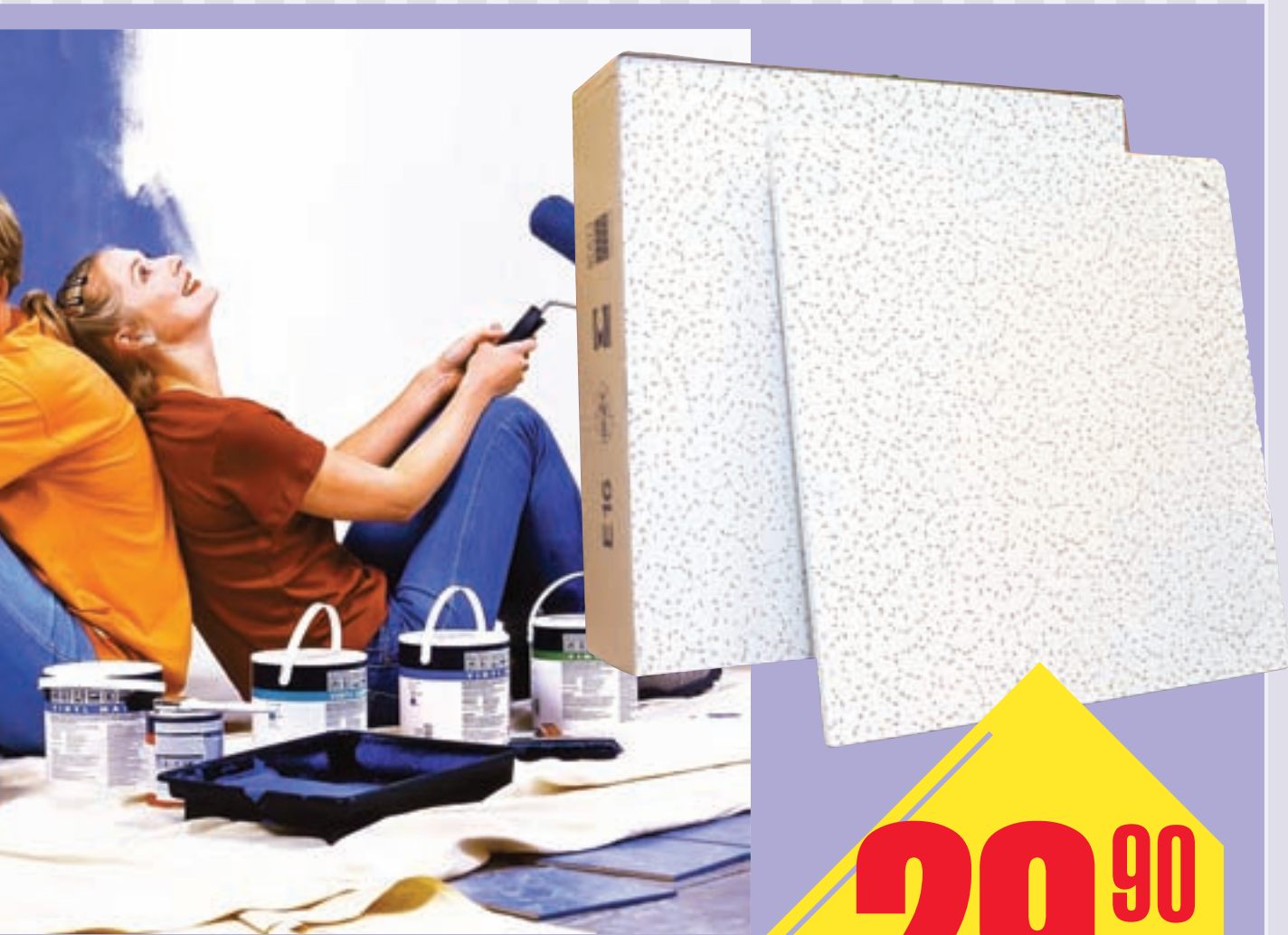
Плита акустична «Комет ОВА» розмір: 600x600x12 мм